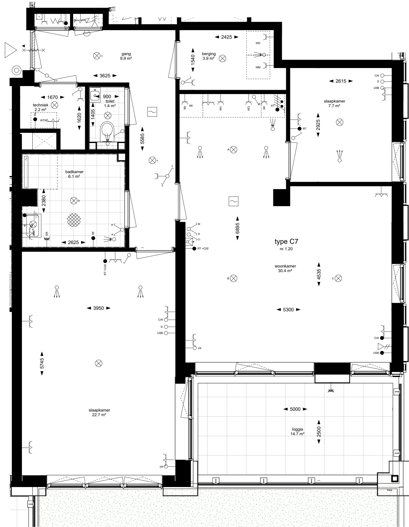
woningtype C7 bouwnummer 1.20

alle maten zijn circa maten het betreft een transformatieproject waardoor afwijkingen in maatvoering groter kunnen zijn dan gebruikelijk bij nieuwbouwprojecten